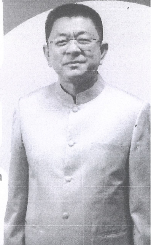
นายชอร ศรีชวนโททัย อธิบดีกรมส่งเสริมการปกครองท้องถิ่น

5. สนับสนุนให้อาสาสมัครท้องถิ่นรักษ์โลก ร่วมกันรณรงค์ใช้กระทง 1 ครอบคร้ว ต่อ 1 กระทง เลือกใช้วัสดุที่ทำจาก ธรรมชาติ ร่วมกันคัดแยกขยะ และรักษาความสะอาด